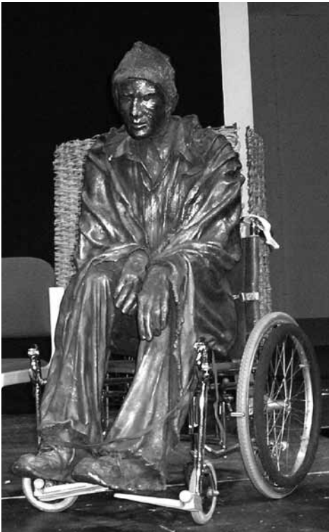
FEANTSA konverentsil kõitsid osavõtjate tähelepanu pronksi valatud kodutute kujud.

Tavaliselt toimub FEANTSA iga-aastane konverents oktoobris, iga kord eri riigis. 2009. a toimus see Taanis, Kopenhaagenis, kus mitme päeva jooksul oli võimalik kohapeal tutvuda nii riikliku poliitikaga kui ka kolmanda ja erasektori tegevusega. Kuna tegemist oli FEANTSA 20. aastapäeva tähistava sündmusega, oli konverents ka vormiliselt üsna elevust tekitav. See algas ühise laulmisega, lõppes teatriga ja kõik, mis selle vahele jäi, oli huvitav ja hariv.