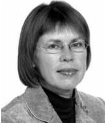
Kai Saks Tartu Ülikool

Geriaatrilise haige, samuti puudega inimese probleemid on tavaliselt väga mitmekesised, meditsiinilised probleemid põimuvad õendushoolduse ja hoolekande vajadusega. Iga üksik spetsialist võib oma tööd teha kui tahes hästi, kuid ilma toimiva professionaalse võrgustikuta jääb abi episoodiliseks ning abivajaja sageli rahulolematuks.