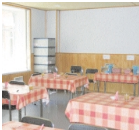
Tänavu märtsis avati Pärnus Tammiste hooldekodu uus hoonetekompleks.