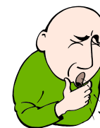
Кашлица, която продължава повече от три седмици