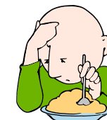
Загуба на апетит