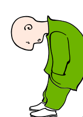
Да се чувстваш слаб или уморен

Ако имате някой от тези симптоми, които определят туберкулоза Вие трябва да отидете на лекар! Не се бавете! Отидете незабавно!