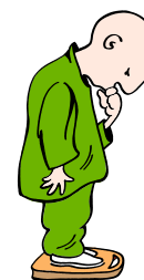
Загуба на тегло